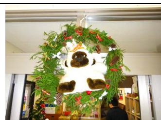
あっ！メリー・ゴリスマス