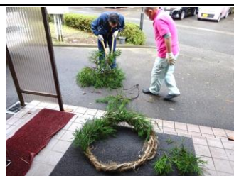
わかか状にさしていきます