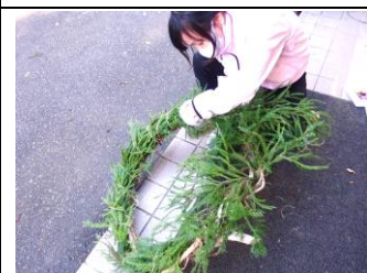
蔓状の根っこに杉の葉を