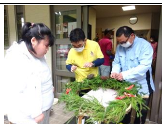
輪っか少し大きくない？