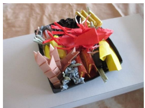
「折り紙 be おせち」