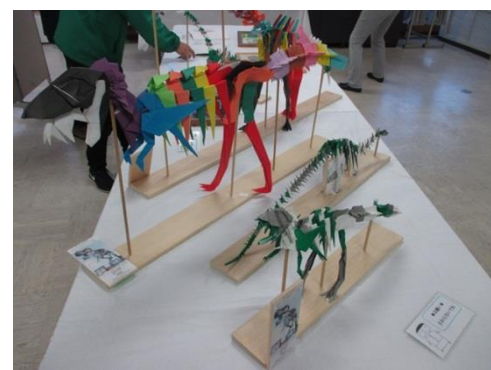
「恐竜古代生物ロボット」